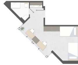
Estudio Doble Estándar (desde 30m2) Twin Studio Standard (from 30m2)