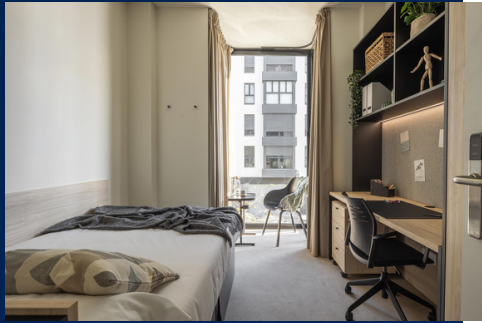
Twodio Estándar y Superior (desde 15m2) Standard & Superior Twodio (from 15m2)