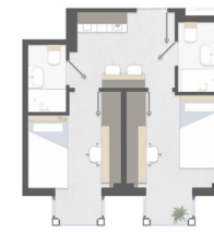
Twodio Premium (desde 16m2) Premium Twodio (from 16m2)