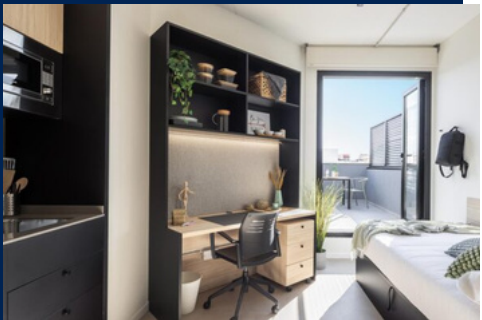
Estudio Premium Terraza (desde 13m2) Studio Premium (from 13m2 + terrace)